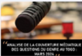
Mars 2024 : rapport sur la couverture médiatique des femmes au Togo