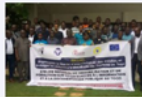
Le CONAPP adresse l'équation de l'accès à l'information au Togo