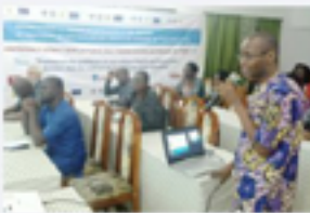
Radioscopie de la représentativité des femmes dans les médias