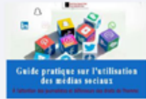
Guide d'utilisation des médias