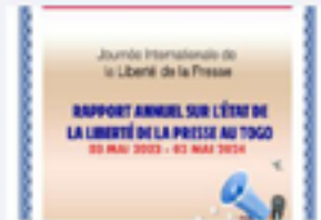
Rapport sur l'état de la liberté de la presse au Togo (2024)