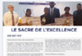
Bulletin OTM INFOS, n° 03, Juin 2024