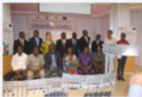
FoE Togo finance 9 microprojets