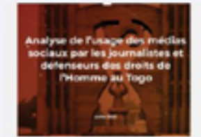
Analyse de l'usage des médias