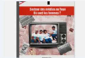
Secteur des médias au Togo : où