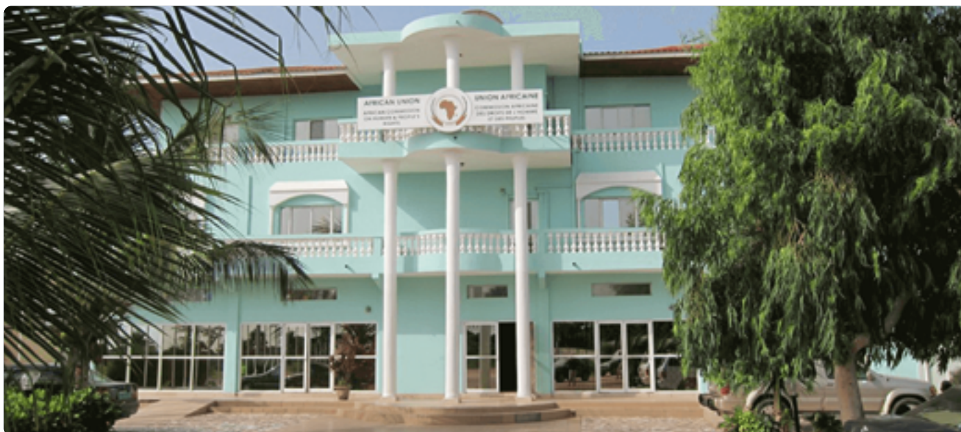
Siège de la CADHP à Banjul

Pour accroître la visibilité des incidents affectant les journalistes et les défenseurs des droits de l'homme et pour influencer les politiques publiques par les instances régionales, le projet FoE Togo participera à la 81e session de la Commission Africaine des Droits de l'Homme et des Peuples (CADHP), qui se tiendra à Banjul du 17 octobre au 6 novembre 2024.