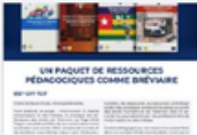
OTM INFOS : Numéro 01- Janvier