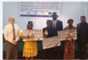
FOE TOGO prime 3 journalistes