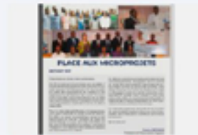
Bulletin FOE TOGO 002, avril 2024